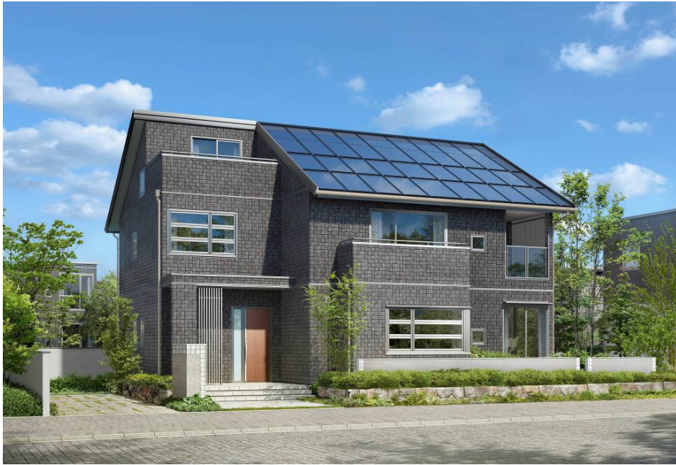
2階建て ドマーニ G