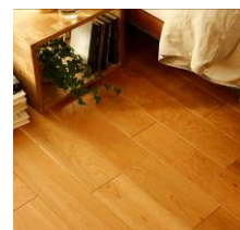
<銘木プレミアムフローリング-チェリー>