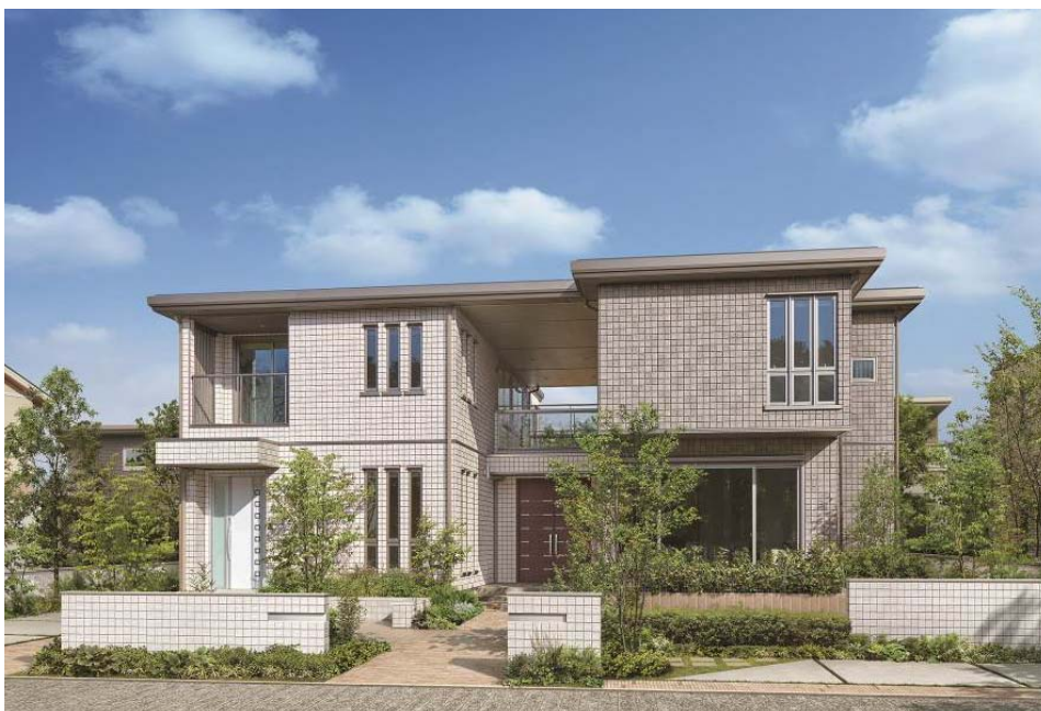
2階建て パルフェ G