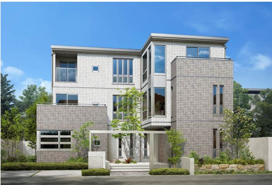
3階建て デシオ G