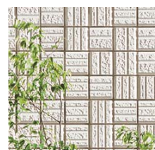
<レジデンススタイル-G>

さらに内装の質へのこだわりとして、天然銘木(アッシュ、チェリー、ウォールナット、メイプル)の美しさと、優れた耐久性を備えた「銘木プレミアムフローリング」を追加しました。