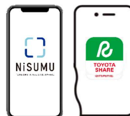
NiSUMU と TOYOTA SHARE を連携

また、シェア車両にはハイブリッド車を採用し、静かで上質な乗り心地を提供するとともに、走行時に発生するCO 2 排出量を削減することで、地球環境にも配慮します。